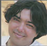
監督・脚本・音楽家 プラブ・シャム・アチャリア