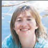
ナレーション ジュリー・ロジャース